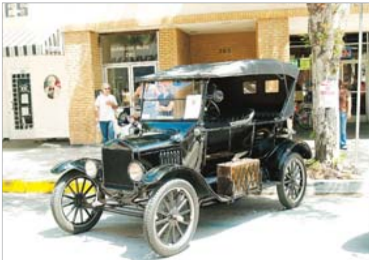
▲ Старинные автомобили в Пасадене.

Я перебрала 500 с лишним томов и пересняла 90. Вкривь, вкось, иногда с собственными пальцами в кадре – но все-таки. Думаю со временем выложить эти книги в Интернет, чтобы каждый мог их прочитать.