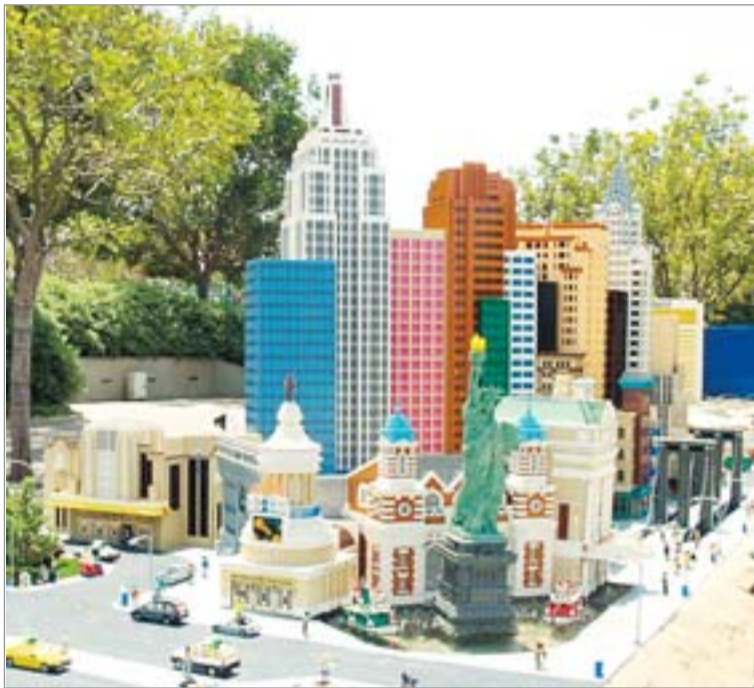
▲ Парк «Лего-ленд», Лас-Вегас.

– Я знаю, что вы разбирали библиотеку при православной церкви в Лос-Анджелесе. Что