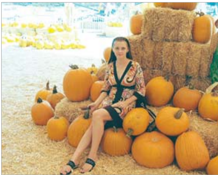
▲ Распродажа тыкв перед хеллоуином.

из-под носа большевиков около 30 кораблей. После долгих скитаний тысячи русских беженцев оказались в Китае – без знания языка, без денег, без связей. Шанхай тогда называли «городом греха»: роскошные автомобили и голодные рикши, веселый джаз и дикий феодализм, французские вина и афганский опиум. В те времена в Китае жила самая большая зарубежная диаспора русских, вот об их судьбах я и буду рассказывать.