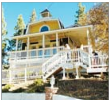
▲ Дача на горнолыжном курорте.